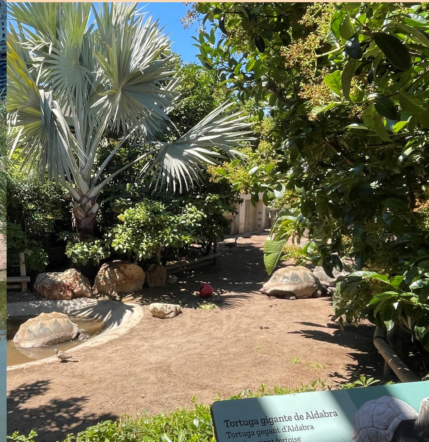
Tortuga gigante de Aldabra Tortuga géant d'Aldabra Giant tortoise